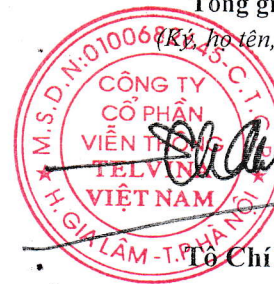
Tô Chí Thành